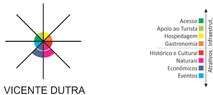
Figura 2: Resultado do Radar de Vicente Dutra.

A partir das informações apresentadas até então neste relatório, entende-se que as condições do cenário turístico na cidade de Vicente Dutra podem ser assim representadas: