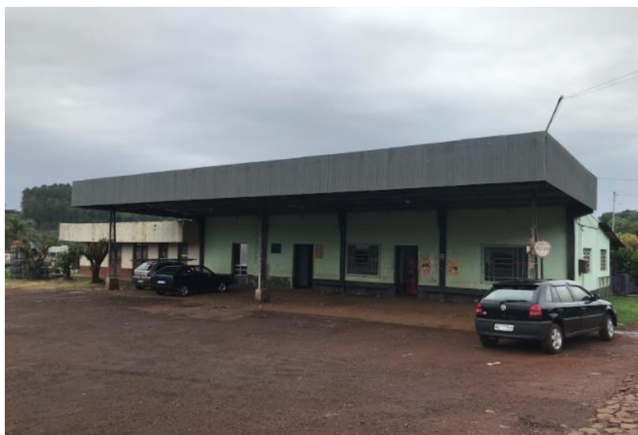
Foto 1: Área de embarque/desembarque da Estação Rodoviária de Erval Seco.

No entanto, o espaço não possui boxes delimitados para embarque e desembarque de passageiros. Na área externa, há bancos sem manutenção. Na área interna, há um sanitário que carece de estrutura de qualidade e limpeza, balcão para venda de passagens com quadro de horários dos ônibus e um bar e lancheria. Não há informativos sobre o horário de atendimento no local, porém foi informado que o mesmo fica aberto entre os horários de chegada e saída dos ônibus. Não há outras conveniências, como caixas eletrônicos, nem recursos de acessibilidade. Na área externa, há sinalização da existência de um ponto de táxi , no entanto, há somente um informativo que exibe o contato telefônico de diferentes taxistas, não tendo sido encontrados veículos em espera no dia da visita. No município de Erval Seco, não há serviço de transporte por aplicativo em funcionamento.