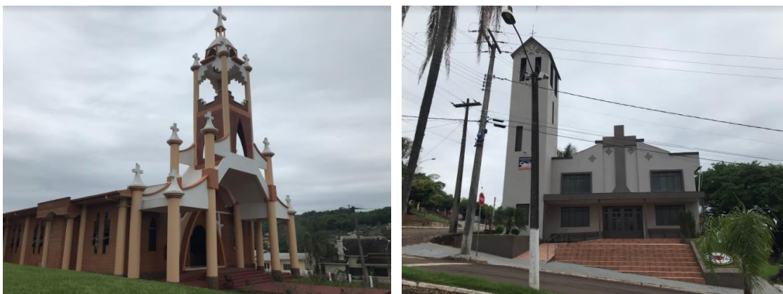
Foto 3: Par quia Santa Terezinha (esq.) e Par quia Luterana Martin Luther (dir.).

Ervál Seco tem, ainda, duas igrejas principais, localizadas de forma contígua e a dois quarteirões da Praça do Imigrante, com estilos de construção modernos: a Paróquia Santa Terezinha e a Paróquia Martin Luther . Ambas recebem a comunidade local e moradores do entorno para a celebração de missas, cerimônias e romarias. A Paróquia Santa Terezinha permanece aberta para visitaç o durante o dia, tem acessibilidade para pessoas com mobilidade reduzida, por meio de rampas, e fornece  lcool gel na entrada. A Paróquia Martin Luther permanece fechada ao longo do dia, n o sendo poss vel fazer visitaç o em hor rio alheio aos das cerim nias. Esta tamb m conta com acessibilidade por meio de rampa.